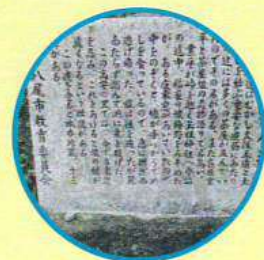
神立茶屋辻の石碑

●八尾市神立6丁目 街道筋でにぎわった茶屋跡。在原業平と茶屋の娘の恋物語でも知られる。