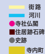
街路 水路(堀) 寺社仏閣 住居跡石碑 史跡 寺内町

▲長瀬川はかつての大和川。八尾寺内町側には八尾浜、久宝寺寺内町側には久宝寺船着場があつた。