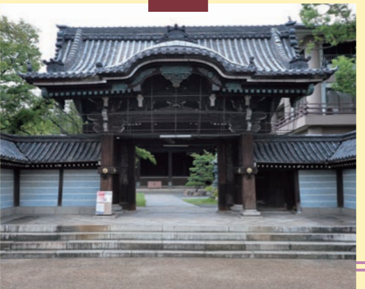
顕証寺 浄土真宗本願寺派 八尾市久宝寺4-4-3

をはじめとする農産物や大和川の水運による久宝寺の隆盛が大坂という都市の活況の一端を担ったといえるだろう。「もうかりまっか、というあいさつは、真受けていますか、つまり仏法が届いていますか、という意味なんですよ。大阪商人のあいさつもまた仏教に根ざっていた。