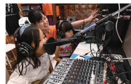
こちらはFMちゃおのサテライト放送局。マイクを前にすっかりDJ気分

八尾市内の企業が集まって企画されただけに、中々のワクワク感がギッシリ。これまで開かれたいくつものワークショップは、子どもたちのための「親子の体験プログラム」。「子ども向けメイクレッスン」「キラキラハブラシをつくろう」「ロボホン」でロボットプログラミングを体験してみよう! 「オリジナル障子づくり」と、タイトルを聞いただけでも面白そうな学べる展開は、「みせるばやお」ならではの魅力。秋から魅せるラインナップが満載で、文字通り「魅せる場」。八尾の魅力子どもたちに体感してもらおう施設の誕生です。