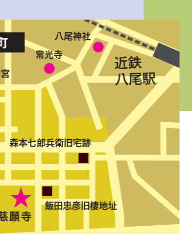
街路 水路(堀) 寺社仏閣 住居跡石碑 史跡 寺内町