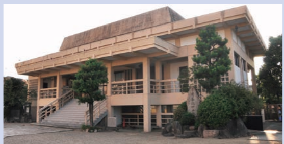
八尾別院大信寺 真宗大谷派 八尾市本町4-2-48

こちらは慶長十二年（1607年）に教如上人が開創。東本願寺の八尾別院、八尾御坊だ。「京都の天明の大火で本山東本願寺が類焼したとき、八尾別院の旧本堂は解体され、淀川をさかのぼって本山の御影堂になっていた時代があります」と大信寺の墨林亮列座。「再び帰ってくるまでに約10年。八尾御坊は大寺院でした」と（別院の代表）の按察