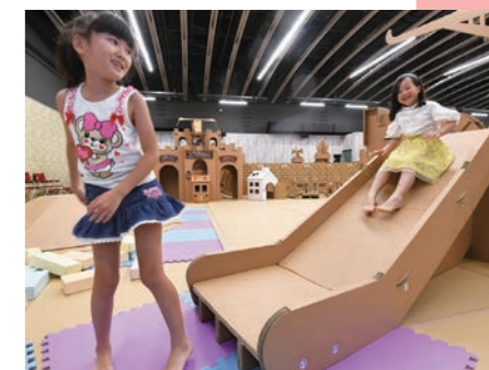
8月のこの日は「ダンボール遊園地ハコモ」。ダンボールで作った海賊船や滑り台、ダンジョン(迷路)をはじめまじりに遊びの王国