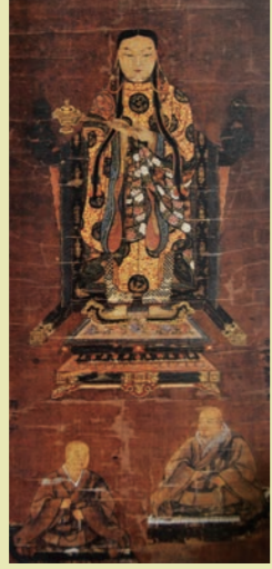
「聖徳太子・親鸞聖人・存如上人連座像」。寛正二年（1461年）8月1日の日付がある。連如上人が法円に与えたとされる

門弟のひとり、信願房法心。聖人の遺言に従って弘安三年（1780年）久宝寺につくった道場に始まる。「その後連如上人の時代、慈願寺は法円のとくに河内への教団の広がり、重要な役割を果たします」。