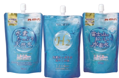
ブルーが印象的な水素水。新たな健康飲料の展開

「水素水は大阪府大などの研究で疲労に対する効果が報告されていますが、美と健康をテーマにした商品開発は今後も要になるので