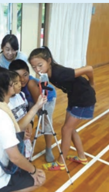
撮影を学ぶ子どもたち。みんな真剣な表情

そして8月23日は完成試写会。さらに作業は続く。映画のタイトルやパンフレットのあらすじ、スチル写真など映画伝もみんなで考えた。大勢のお客さんに見てほしい。思いはひとつだ。