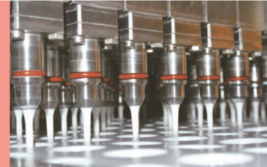
無菌のフレッシュ充填システム