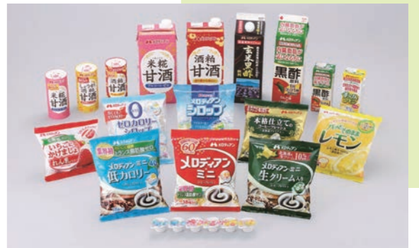
多彩な代表商品のラインナップ

トラバック容器で売り出した。これも往年のCMだが「コーヒーをまるやかに豊かにするメロディアン・ミニ」。年配の、欠かせない派の支持は根強い。