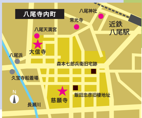
街路 水路(堀) 寺社仏閣 住居跡石碑 史跡 寺内町