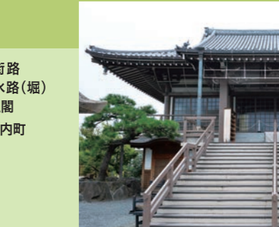
恵光寺 浄土真宗本願寺派 八尾市萱振町4-1