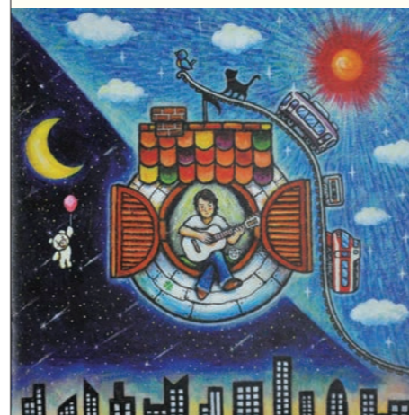
半田健人「HOMEMADE」ジャケット