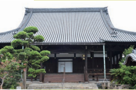
慈願寺 真宗大谷派 八尾市本町3-5-5

門弟のひとり、信願房法心。聖人の遺言に従って弘安三年（1780年）久宝寺につくった道場に始まる。「その後連如上人の時代、慈願寺は法円のとくに河内への教団の広がり、重要な役割を果たします」。