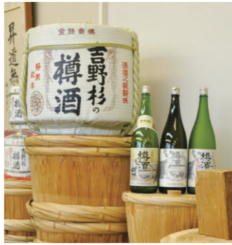
吉野杉の香りで醸し出される「吉野杉の樽酒」