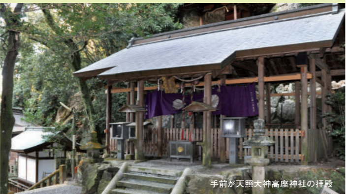
手前が天照大神高座神社の拝殿

岩谷とも岩戸とも呼ぶらしい、こちらは弁財天の赤いほりが並び、少し仏教色を感じる。しおりには「弁財天参拝」とあり、岩窟弁財天岩戸神社と書かれている。「祭神は市杵島姫(いちきしまひめ)大神、神仏習合では弁財天にあたります。