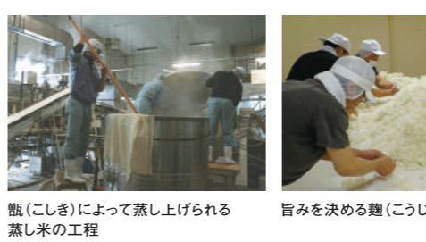
瓶(こしき)によって蒸し上げられる蒸し米の工程