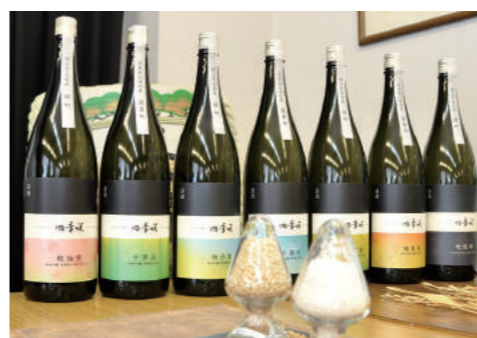
二十四節気、七十二候の名がついた「四季咲」