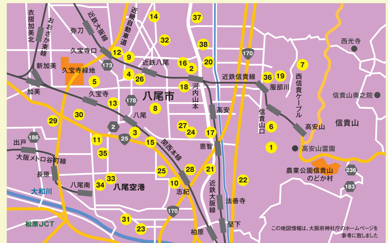
この地図情報は、大阪府神社庁のホームページを参考に致しました

八尾市の神社の詳細情報は、大阪府神社庁のホームページをご覧ください。 http://www.jinjacho-osaka.net