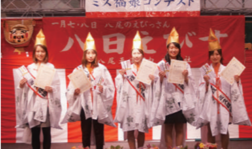
笑顔をふりまいてくれるミス福娘さんたち

江戸時代の新田開発、享保年間に石清水八幡宮から神霊を勧請してこの地の鎮守として創建された。その後、山本新田は住友家の所有となり、昭和に至る一帯の宅地開発が行われた。近鉄河内山本駅を降りると立派な社殿が目に入る。