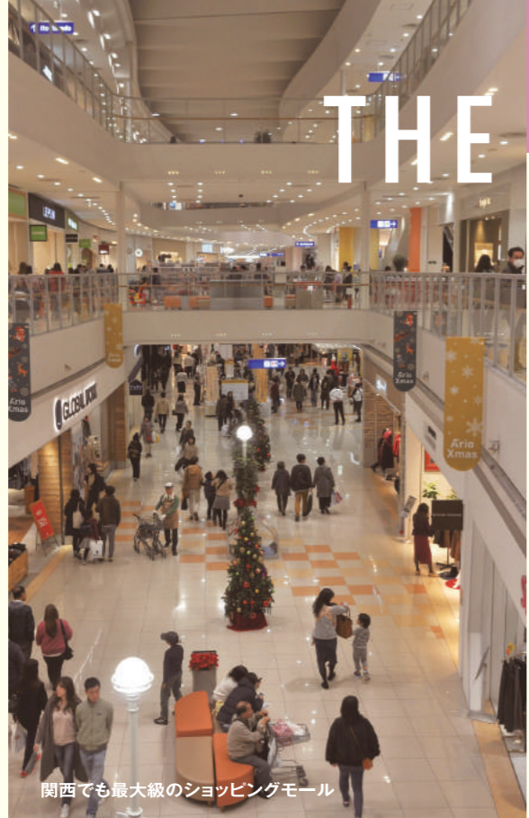
関西でも最大級のショッピングモール