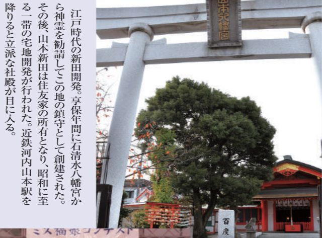
▲山本新田の開発にちなんで創建された山本八幡宮

江戸時代の新田開発、享保年間に石清水八幡宮から神霊を勧請してこの地の鎮守として創建された。その後、山本新田は住友家の所有となり、昭和に至る一帯の宅地開発が行われた。近鉄河内山本駅を降りると立派な社殿が目に入る。