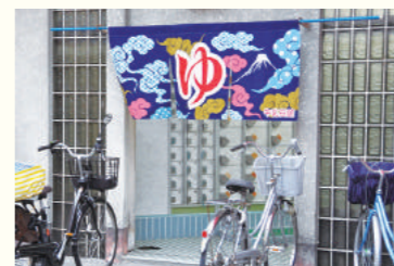
夕方、お客さんの自転車が並び始めた(山本新温泉)