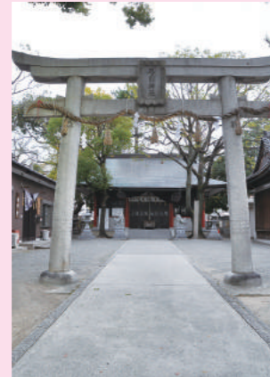
西の弓削神社(八尾市弓削町)▼

か。八尾には弓削の名と由義の名をもつ3つの神社がある。ひとつは境内に「由義宮舊址(きゅうし)」の石碑が建つ由義神社(八尾木北)。そして長瀬川をはさんで東の弓削神社(東弓削)と西の弓削神社(弓削町)。かつての若江郡と志紀郡にあたる。東西ともに物部氏の祖神をまつっており、由義神社は「荘厳な式内河内五社の一社」だったという。弓削氏は弓矢な