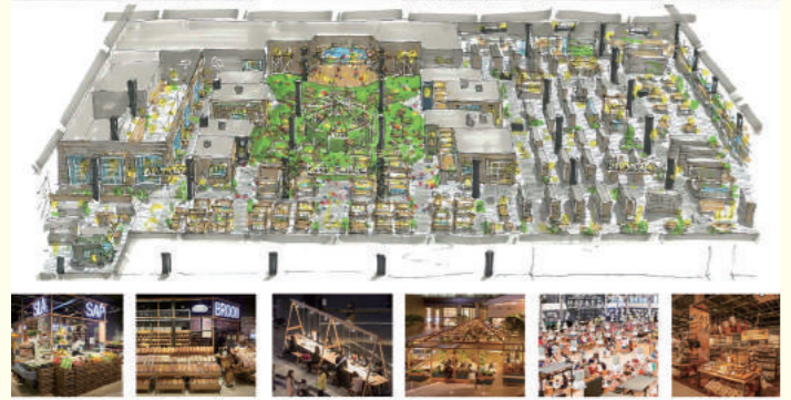
ナレホールなどが入る1階部分のイメージプラン