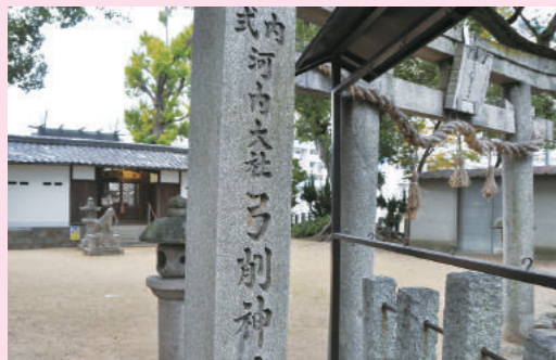
碑文に「式内河内大社」と彫られた東の弓削神社(八尾市東弓削)

か。八尾には弓削の名と由義の名をもつ3つの神社がある。ひとつは境内に「由義宮舊址(きゅうし)」の石碑が建つ由義神社(八尾木北)。そして長瀬川をはさんで東の弓削神社(東弓削)と西の弓削神社(弓削町)。かつての若江郡と志紀郡にあたる。東西ともに物部氏の祖神をまつっており、由義神社は「荘厳な式内河内五社の一社」だったという。弓削氏は弓矢な