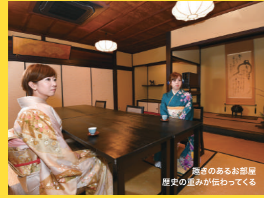
趣きのあるお部屋 歴史の重みが伝わってくる