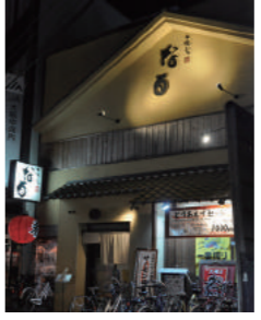
「あじ処なる」八尾店は長龍の酒が並ぶ蔵元の直営店

四季を味わう酒なのだ。併設されたアンテナショップ「蔵の店」では地元の農家に作ってもらった米を使用し誕生した酒「広陵蔵」が並ぶ。その横には「昇道無窮極」と社名のあめしい名がついた純米大吟醸があった。備前雄町の精米歩合38%という絶品だ。日本酒ブームが続いている。「ひとつは海外へも波及した和食ブーム。そして東日本大震災で被災した宮城などの蔵元を救おうと日本酒を飲む機運が盛り上がったこと。若い女性たちが牽引しています。長龍でも「露葉風を愛しむ会」など様々な発信でファン層を広げている。「なるほどよい酒」はきめ細やかな仕事の末にできあがる。