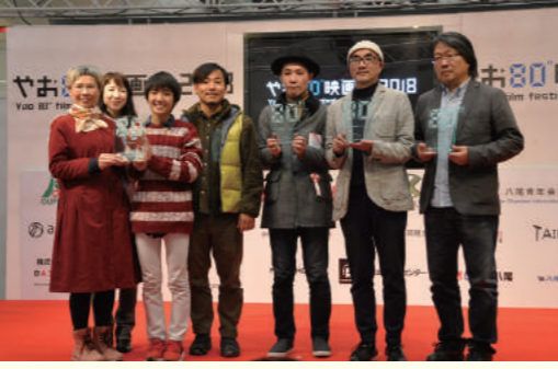
「やお80」映画祭2018の受賞者たち

たとえば3階のレストラン街には地元寺内町の雰囲気を取り入れた。地元貢献の思いがありますからレストラン街からいかに寺内町に誘導するかも考えます。運用が鍵ですね。