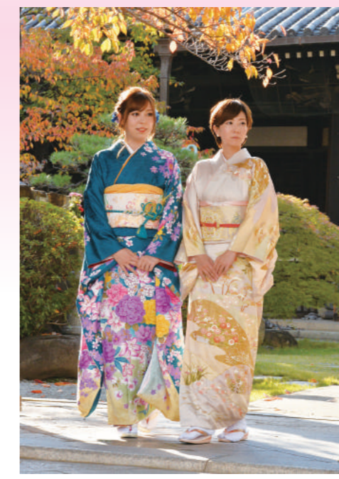
寺内町の中核を成す、顕証寺を訪れた(撮影時は紅葉が見事でした)