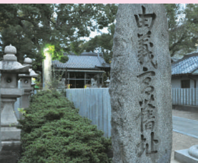
由義宮の跡と記された石碑のある由義神社

弓削道鏡と女帝、称徳天皇。ふたりの夢は「由義宮ゆげのみや」といふ未完の西京に結実する、はずだった。弓削の地に建立が進められたと記された幻の寺、由義寺の存在は、1916年の発掘調査で奈良時代の瓦が大量に出土、翌年、巨大な七重塔の可能性もある基壇が見つかり、ほぼ確実になった。徐々に