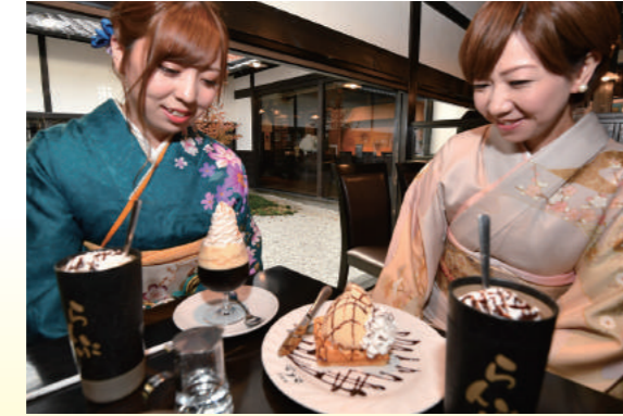
極上スイーツに笑顔のふたり。心持ち上品に