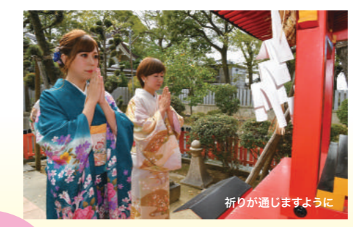
祈りが通じますように