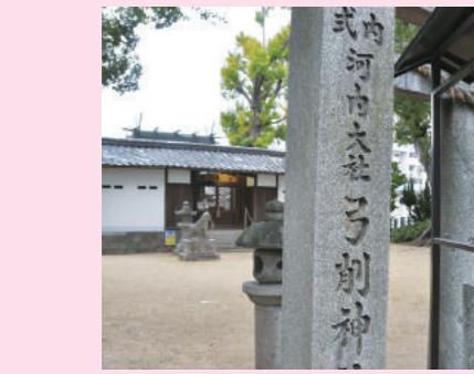
碑文に「式内河内大社」と彫られた東の弓削神社(八尾市東弓削)