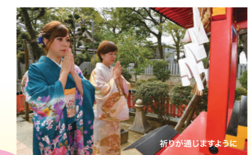
祈りが通じますように