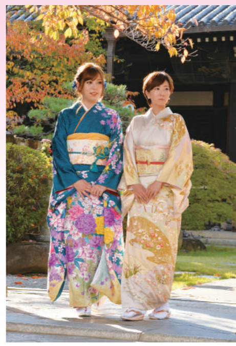
寺内町の中核を成す、顕証寺を訪れた(撮影時は紅葉が見事でした)