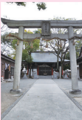
西の弓削神社(八尾市弓削町)▼