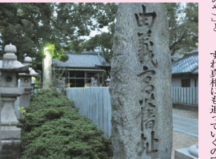
由義宮の跡と記された石碑のある由義神社