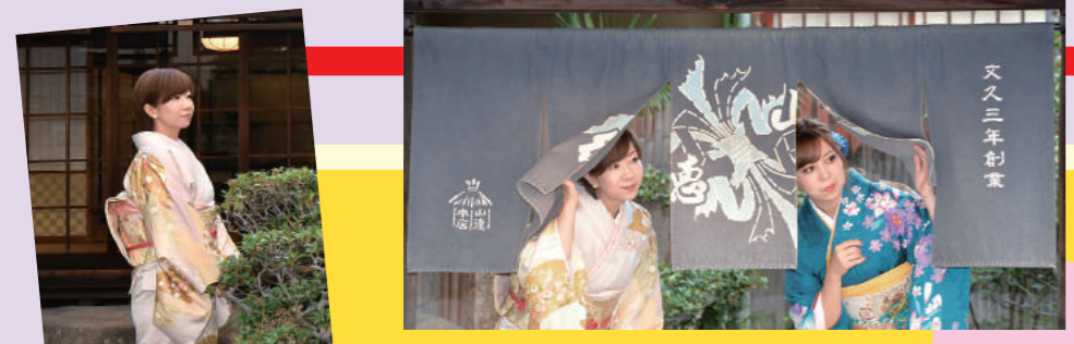
お庭にたたくみ季節を賞でる