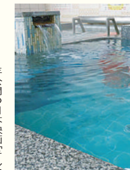
湯口から流れるお湯に浸かって(豊栄温泉)

大阪府公衆浴場業生活衛生同業組合では、「大きなお風呂の効用」として、「身体が早く温まり、温もりが持続するので、腰痛や肩こり改善!」「リラックス効果で疲れやストレス知らず!」に加え、美容と健康の味方。銭湯のお湯は「温まりやすく湯冷めしにくい」ため様々な効果が得られやすいという。詳しくはホームページで紹介している。(大阪府公衆浴場組合で検索)