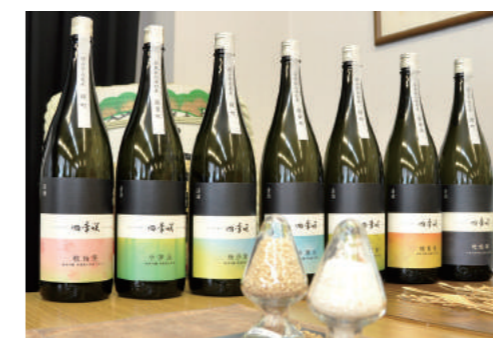
二十四節気、七十二候の名がついた「四季咲」