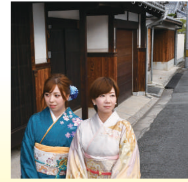
寺内町にて。伝統建築の町には着物が似合う