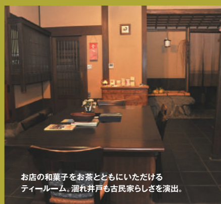
お店の和菓子をお茶とともにいただけるティールーム。溜れ井戸も古民家らしさを演出。

旧八尾街道に面して市内で最も古い、大きな民家が建つ。和菓子店「與兵衛桃林堂」。角の灯籠や扁額には達筆の屋号。店内も古民家をそのまま生かして実に見ごたえと雰囲気のある和の空間だ。日本の四季を表現する和菓子がこころで作られる。