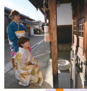
寺内町にはそれぞれの社に地蔵尊が祀られている