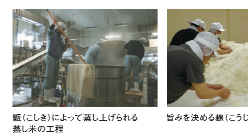
甑(こしき)によって蒸し上げられる蒸し米の工程