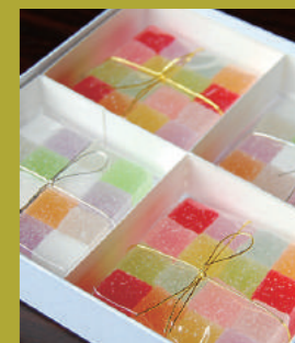
見た目もカラフルな「ゼリー彩」。

菓子製造工房で特別に焼いてもうそうだ。店頭には季節のお菓子の品書き。「紅葉薯蕷(じよふゆ)」「亥の子餅」...。和名が美しい。「一月は花びら餅。羽二重餅の中に味噌あん、うちは「ホウ」と金時「マジン」をはさみます」「今の子供たちは洋菓子慣れをしますがぜひ味わってほしい。和菓子の核心は中身にありませう」