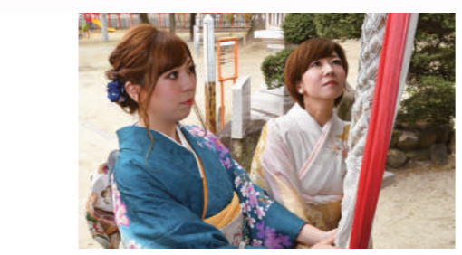
鈴を鳴らして神様に参拝の訪問をお知らせ