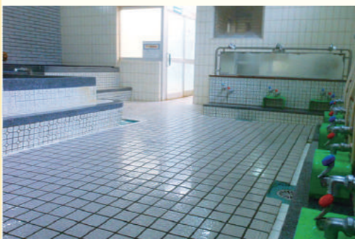
湯船も洗い場もゆったり(ゆ大和)