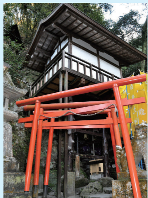
白龍大神をまつる祠

座神社の御祭神は天照大神と高皇産靈(たかみむすび)の大神。元伊勢国宇治山田原に鎮座されていたが、雄略天皇の御代に遷座されたと伝わります。「河内名所図会」には「天岩戸ともいへき岩窟なり」とあり、「高座神社と岩戸神社それぞれ違う岩を御神体としていますが境界ははっきりしません。高安山全体