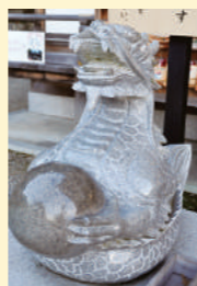
神龍もまた神様のお遣いだ

◆春日さん住吉さんとの深い歴史 近鉄恩智駅から東へ歩くと、131段という長く急な階段を登ると上るとようやく恩智神社の境内。中河内を代表する河内三宮で、東大阪の枚岡神社と並ぶ格式をもつ。すぐ下には「ヤオマテ」夏号でも紹介した恩智神社の神宮寺だ。たぐい感院が、そして大阪平野を見渡す眺望が実に見事だ。