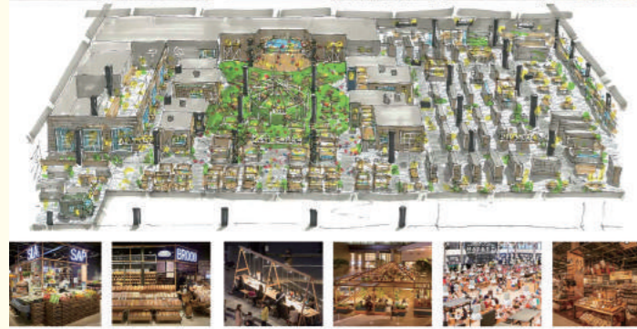
ナレホールなどが入る1階部分のイメージプラン