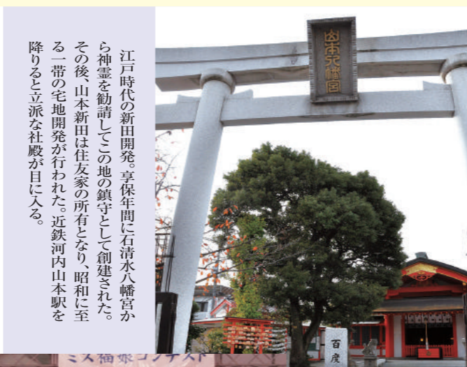
▲山本新田の開発にちなんで創建された山本八幡宮

江戸時代の新田開発、享保年間に石清水八幡宮から神霊を勧請してこの地の鎮守として創建された。その後、山本新田は住友家の所有となり、昭和に至る一帯の宅地開発が行われた。近鉄河内山本駅を降りると立派な社殿が目に入る。