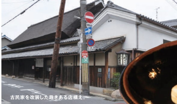
古民家を改装した趣きある店構え。