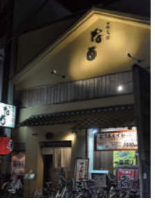
「あじ処なる」八尾店は長龍の酒が並ぶ蔵元の直営店

四季を味わう酒なのだ。併設されたアンテナショップ「蔵の店」では地元の農家に作ってもらった米を使用し誕生した酒「広陵蔵」が並ぶ。その横には「昇道無窮極」と社名のあめしい名がついた純米大吟醸があった。備前雄町の精米歩合38%という絶品だ。日本酒ブームが続いている。「ひとつは海外へも波及した和食ブーム。そして東日本大震災で被災した宮城などの蔵元を救おうと日本酒を飲む機運が盛り上がったこと。若い女性たちが牽引しています。長龍でも「露葉風を愛しむ会」など様々な発信でファン層を広げている。「なるほどよい酒」はきめ細やかな仕事の末にできあがる。