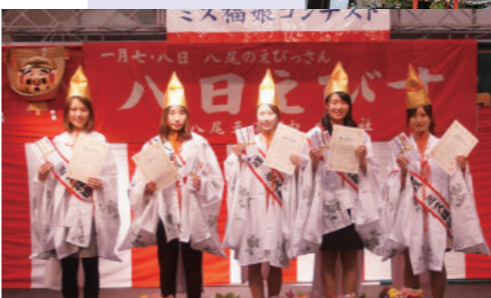
笑顔をふりまいてくれるミス福娘さんたち

江戸時代の新田開発、享保年間に石清水八幡宮から神霊を勧請してこの地の鎮守として創建された。その後、山本新田は住友家の所有となり、昭和に至る一帯の宅地開発が行われた。近鉄河内山本駅を降りると立派な社殿が目に入る。