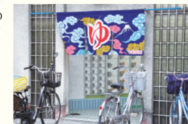
夕方、お客さんの自転車が並び始めた(山本新温泉)