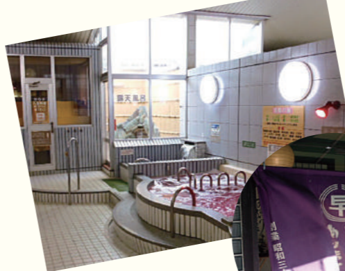
露天風呂も完備 (ヘルシーバスニュー栄)