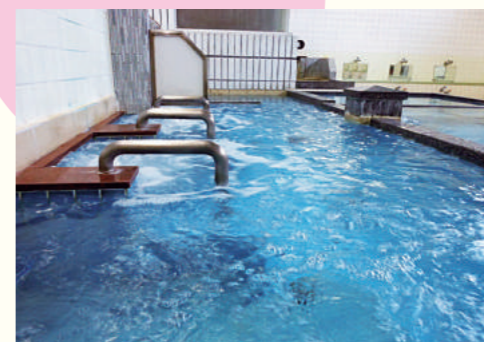
泡風呂が気持ち良さそう(高砂温泉)

「地域には子供たちが出て行ってお年寄りばかりが残る」とも同じですが、「この仕事、燃料費、光熱費がきついな。転業、廃業はやむをえないよ」とはいえ桶さんご夫婦は明るく頑張っている。「お年寄りには必要な場所だと思いますよ。」「お風呂の日の15日は大勢来られます、やっぱり。1週間に1度は来ていただければ。」