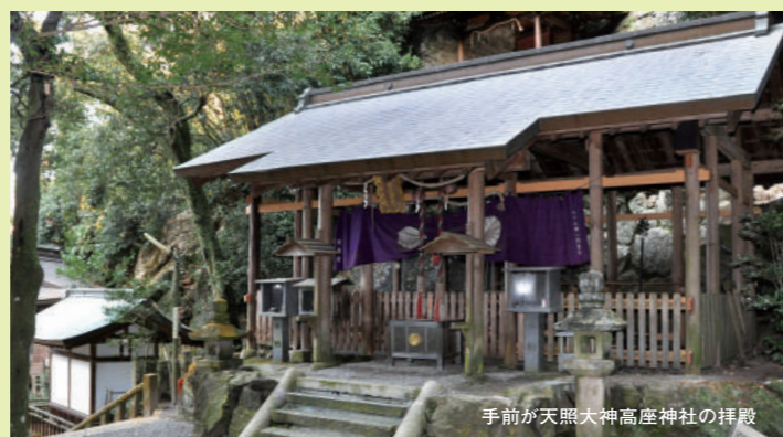
手前が天照大神高座神社の拝殿

岩谷とも岩戸とも呼ぶらしい、こちらは弁財天の赤いのぼりが並び、少し仏教色を感じる。しおりには「弁財天山参拝」とあり岩窟弁財天岩戸神社と書かれている。「祭神は市杵島姫(いちきしまひめ)大神、神仏習合では弁財天にあたります。