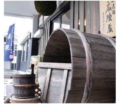
広陵蔵。大きな吉野杉の樽が出迎えてくれる