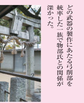
碑文に「式内河内大社」と彫られた東の弓削神社(八尾市東弓削)

弓削道鏡と女帝、称徳天皇。ふたりの夢は「由義宮ゆげのみや」といふ未完の西京に結実する、はずだった。弓削の地に建立が進められたと記された幻の寺、由義寺の存在は、1966年の発掘調査で奈良時代の瓦が大量に出土、翌年、巨大な七重塔の可能性もある基壇が見つかり、ほぼ確実になった。徐々に