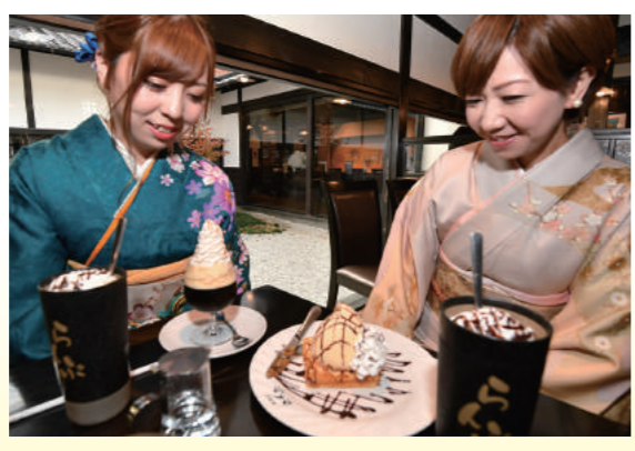
極上スイーツに笑顔のふたり。心持ち上品に