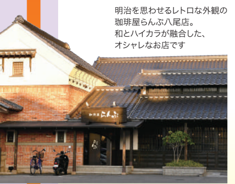
明治を思わせるレトロな外観の珈琲屋らんぶ八尾店。和とハイカラが融合した、オシャレなお店です

料亭 山徳 八尾市本町4-3-28 営業時間: 予約制 定休日: 不定休 TEL: 072-922-2014 http://ryoutei-yamatoku.com