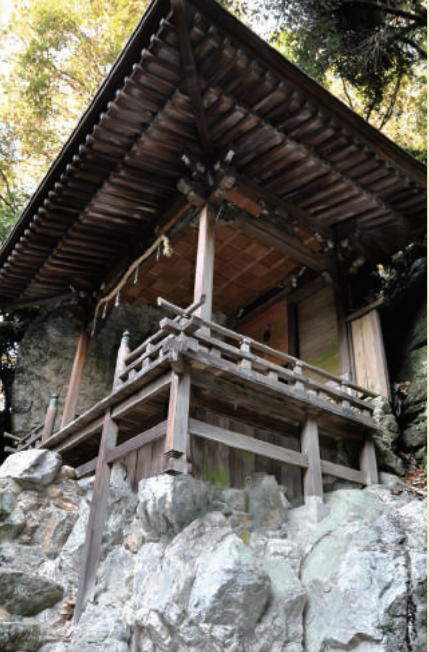
本殿は見上げる場所にある(天照大神高座神社)